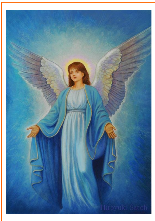
イラスト 佐藤弘之 エンジェルアートのブログ http://ameblo.jp/angel-art2010/

アチューメント創始者 瀬戸武志&宇宙の光 公式HP 宇宙の光 http://hikari1.com/ アメブロ 宇宙の光 http://ameblo.jp/e-stone1/ Eメール TAKESHI hikari@k-suai.com